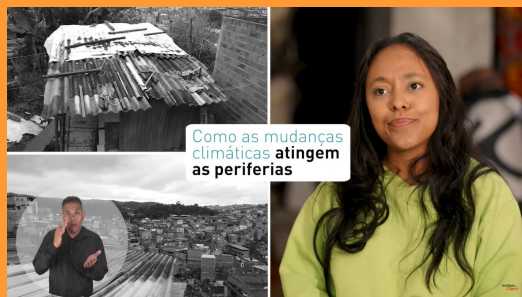
Como as mudanças climáticas atingem as periferias? - Instituto Perifa Sustentável