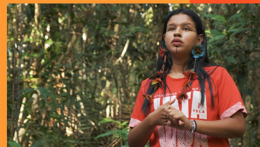
Diz Aí Juventudes Transformadoras - Juventudes e ativismo de beira