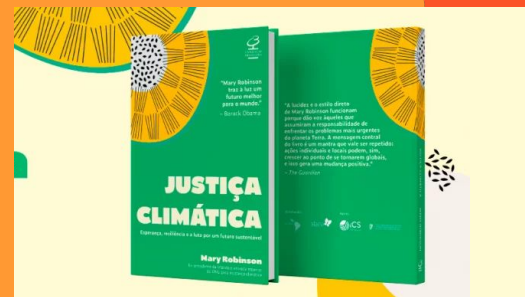
Justiça Climática, por Mary Robinson