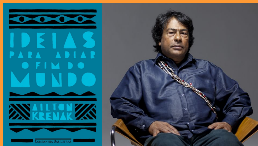
Ideias para adiar o fim do mundo, por Ailton Krenak